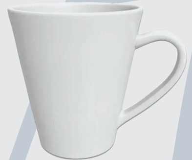
Con cuchara, cónicas, cuadradas, grabadas en sand blast